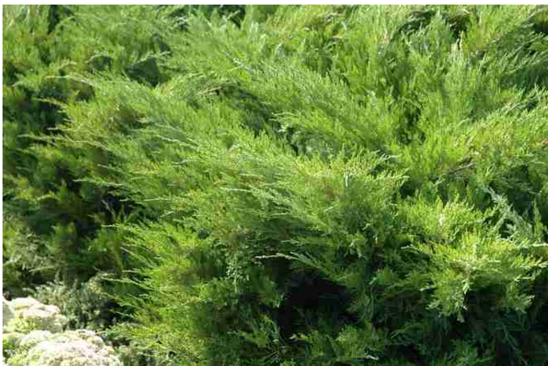
Rys. 12. Jałowiec pośredni 'Mint Julep'