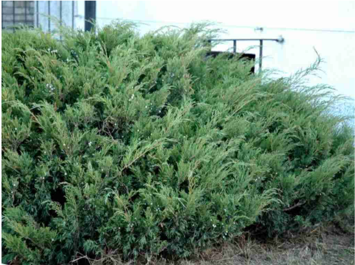
Rys. 8. Jałowiec sabiński 'Blue Danube'