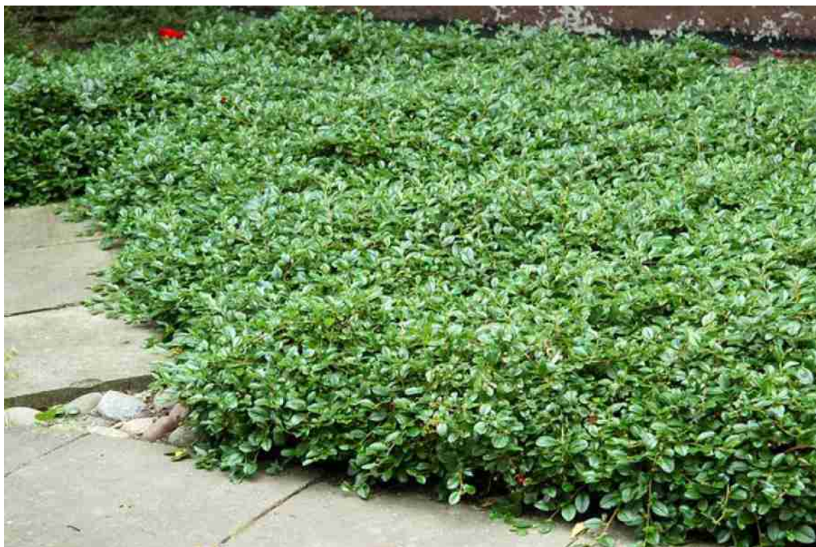
Rys. 6. Igra radicans ‘Eichholz’