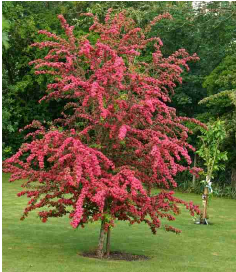
Rys.3. Głóg dwuszyjkowy ‘Paul’s Scarlet’

β) tawuła wczesna – jeden z najlepszych i najobficiej kwitnących krzewów wiosennych o białych kwiatach. Kwiaty tej tawuły zebrane są w płaskie kwiatostany i ułożone wzdłuż całej długości ubiegłorocznych pędów. Pojawiają się na roślinie przed rozwojem liści, w kwietniu. Łukowato przewieszające się pędy tworzą szeroki, gęsty krzew do 1,5 m szerokości i wysokości. Nie ma szczególnych wymagań i nadaje się na wszystkie gleby. Preferuje stanowiska słoneczne. Po kwitnieniu można przycinać młodsze pędy. Najstarsze, słabo kwitnące, należy wycinać u podstawy.