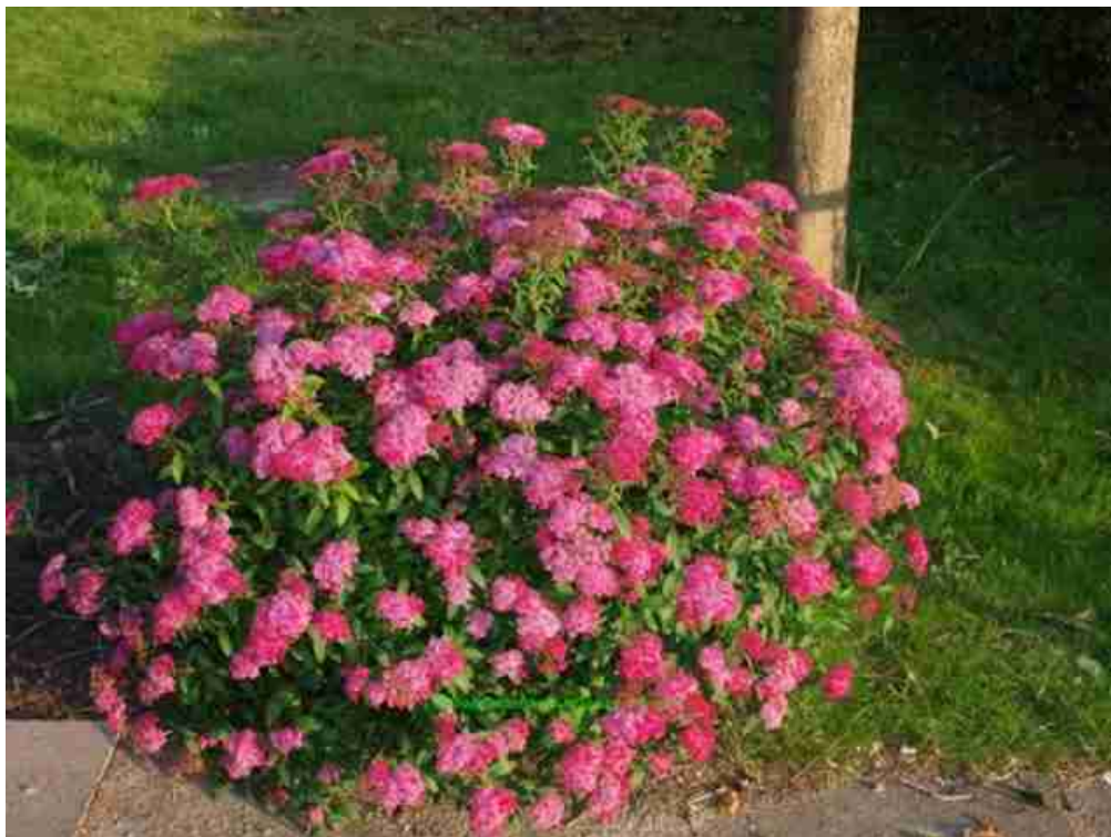
Rys. 5. Tawuła japońska ‘Anthony Waterer’

χ) tawuła japońska ‘Anthony Waterer’ – jest wolno rosnącym krzewem o półkolistym pokroju. Osiąga wysokość i szerokość około 0,8 m. Kwiaty różowoliliowe do rubinowych; kwitnie w VII – IX. Stanowisko słoneczne do półcienistego.