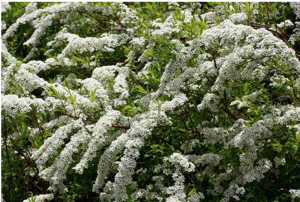
Rys. 4. Tawuła wczesna

χ) tawuła japońska ‘Anthony Waterer’ – jest wolno rosnącym krzewem o półkolistym pokroju. Osiąga wysokość i szerokość około 0,8 m. Kwiaty różowoliliowe do rubinowych; kwitnie w VII – IX. Stanowisko słoneczne do półcienistego.