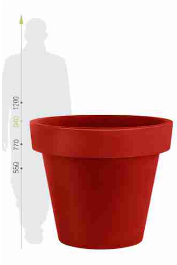
Rys. 13. Donica Gianto 90 czerwona.