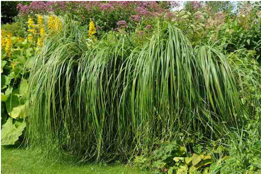
Rys. 11. Spartyna grzebieniasta 'Aureomarginata'