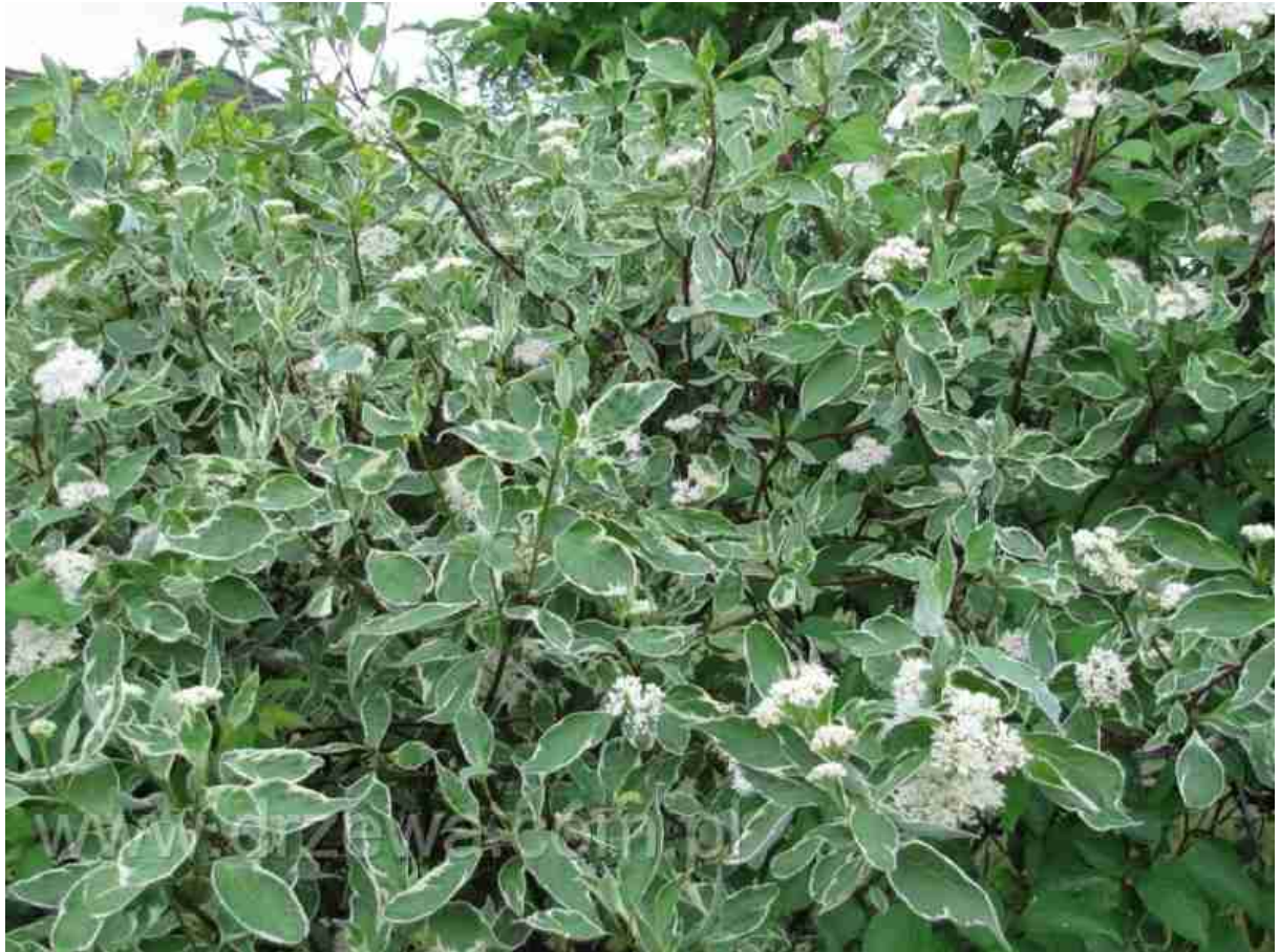
Rys. 10. Dereń biały