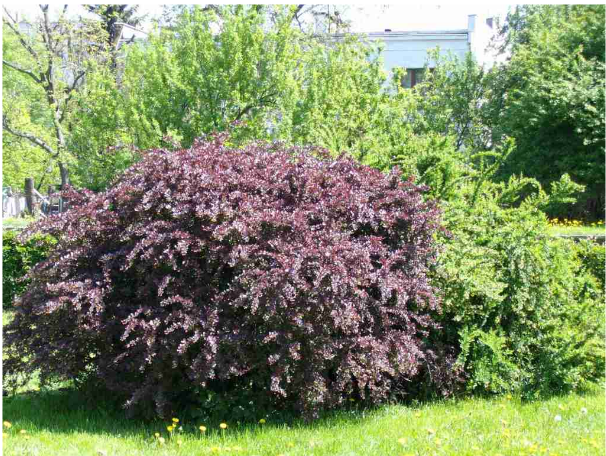
Rys. 7. Berberys Thunberga 'Atropurpurea'