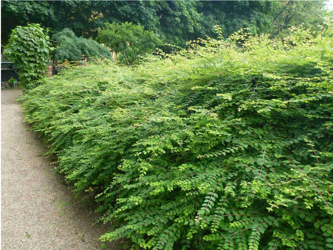
Rys. 9. Śnieguliczka Chenoultia 'Hancock'

wzdłuż ścieżek. Można z niej tworzyć także niskie żywopłoty, oddzielające różne części ogrodu. Doskonale sprawdza się też jako zielen miejska.